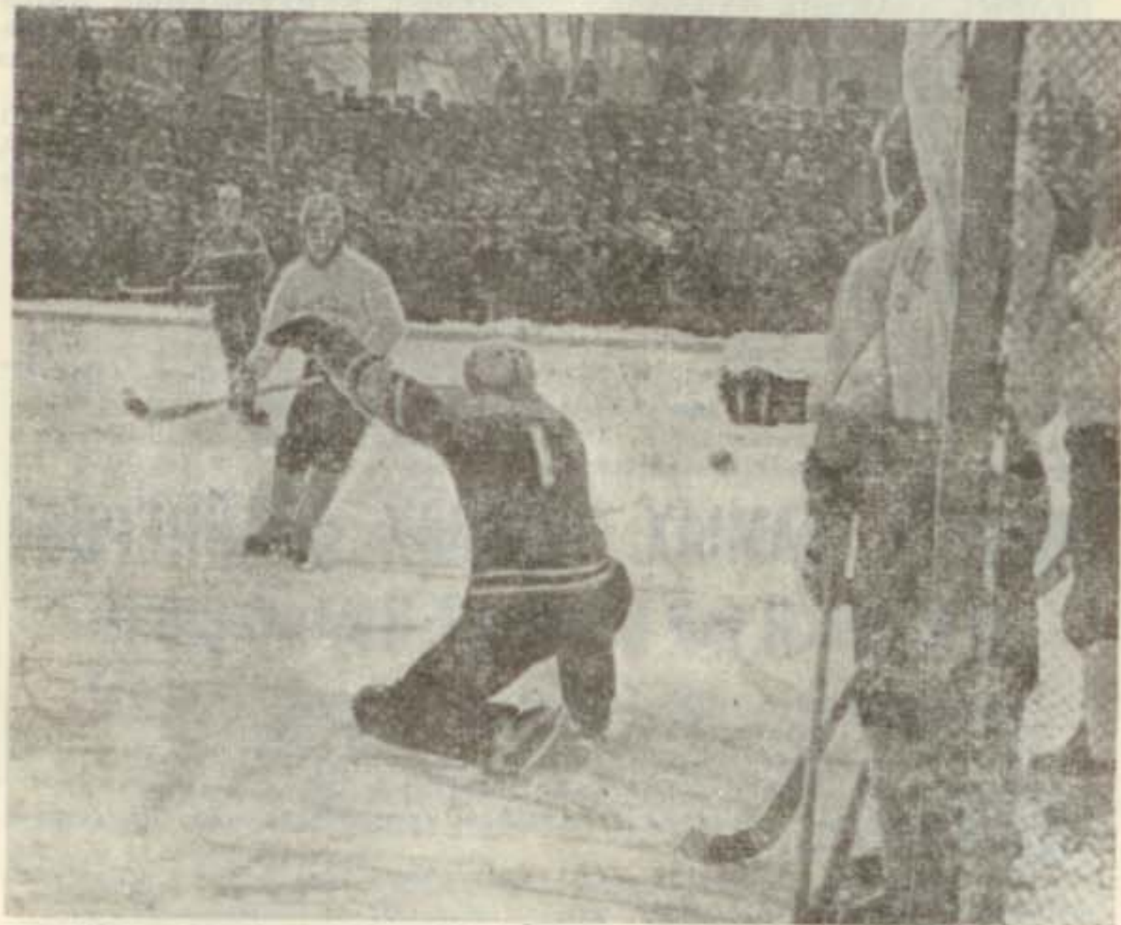
«Водник» — «Динамо» (Москва). 7 декабря 1969 года. Архангельск, стадион «Динамо», 17 тысяч зрителей.