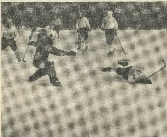
Архангельск. Стадион «Ди- намо».