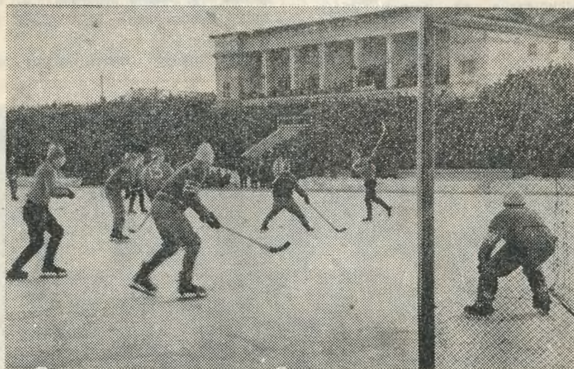
Во время хоккейных матчей трибуны архангельского стадиона «Динамо» никогда не пустуют.

ную команду Финляндии [3:1], наголову разгромила сборную Норвегии [9:0] и проиграла «Тре Крунур» [1:2]. На два гола, забитых «Бемпой» Б. Эрикссоном и Г. Седвалом, наши спортсмены сумели ответить только одним [А. Измоленов]. Но благодаря лучшей разнице забитых и пропущенных мячей [13—3] на высшую ступеньку пьедестала почета поднялась сборная команда СССР. На втором месте хоккеисты Финляндии [4 очка, разница мячей 9—7], на третьем — сборная Швеции [4 очка, разница мячей 6—5]. Юбиляры оказались на четвертом месте [0 очков, разница мячей 5—18].