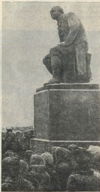
Памятник М. В. Ломоносову в селе Ломоносово близ Холмогор.

Сбылись предвиденья великого Михайлы Ломоносова, страстно мечтавшего увидеть талантливый русский народ просвещенным. По праву Архангельск называют столицей Севера. Растет и хорошеет с каждым днем наш город. Подня-