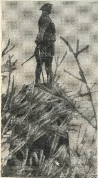
Памятник Петру Первому в Архангельске.

лись новые жилые микрорайоны, мощные корпуса целлюлозных и бумажных комбинатов, перекинулся через широкую Северную Двину красавец — железнодорожный мост. Три высших учебных заведения (медицинский, педагогический и лесотехнический институты) ежегодно выпускают сотни высококвалифицированных специалистов.