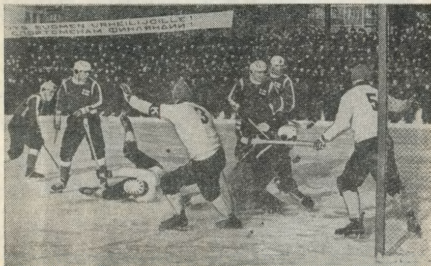
Матч IV чемпионата мира по хоккею с мячом в Архангельске — Финляндия — Швеция (1965 год).