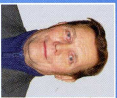
Авторы: Николай ПАРФЁНОВ и Виктор АНТУФЬЕВ. Фото: Виктор Антуфьев и из архива авторов. © 2006