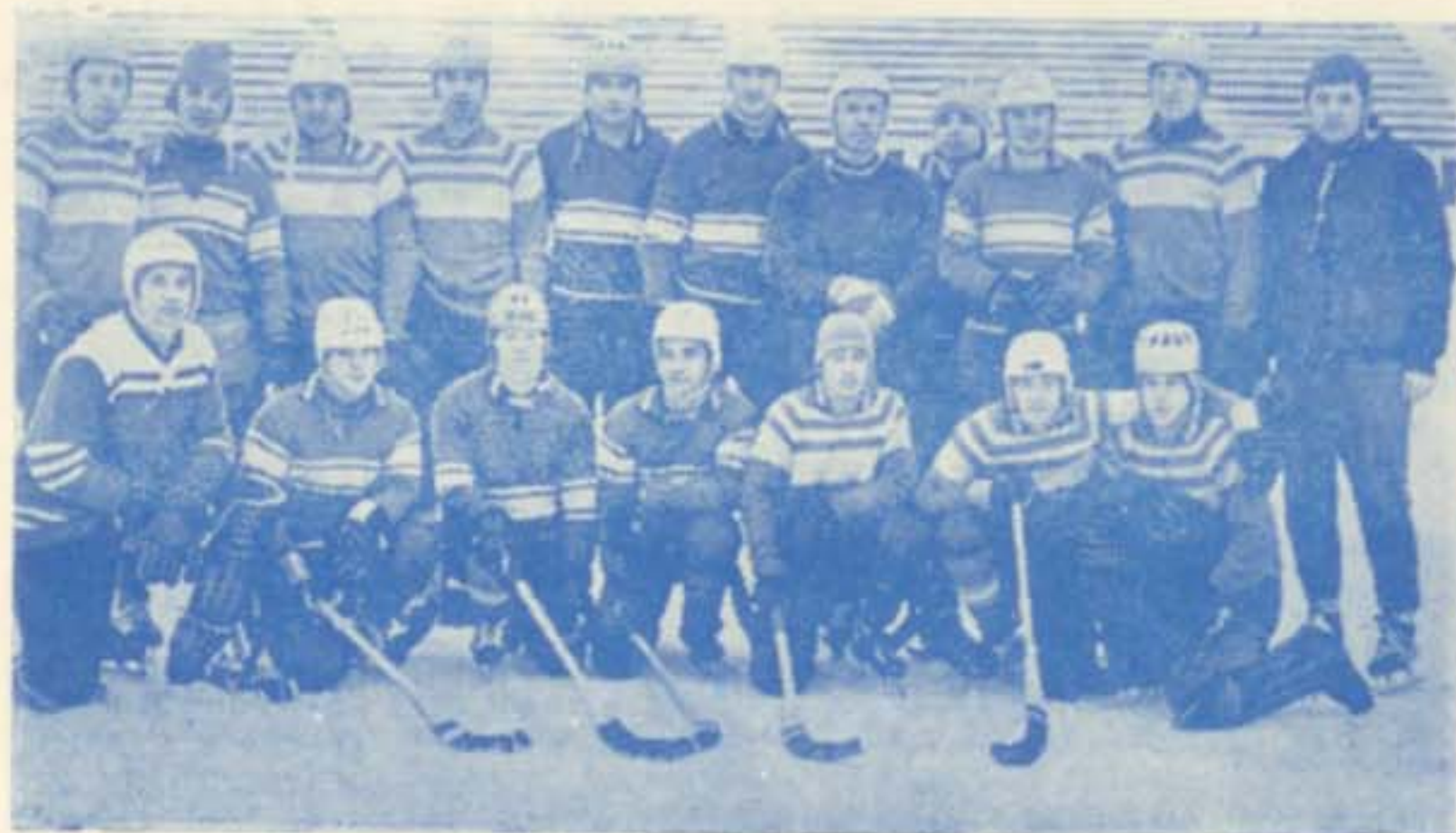
«Водник» (Архангельск), январь 1975 года.