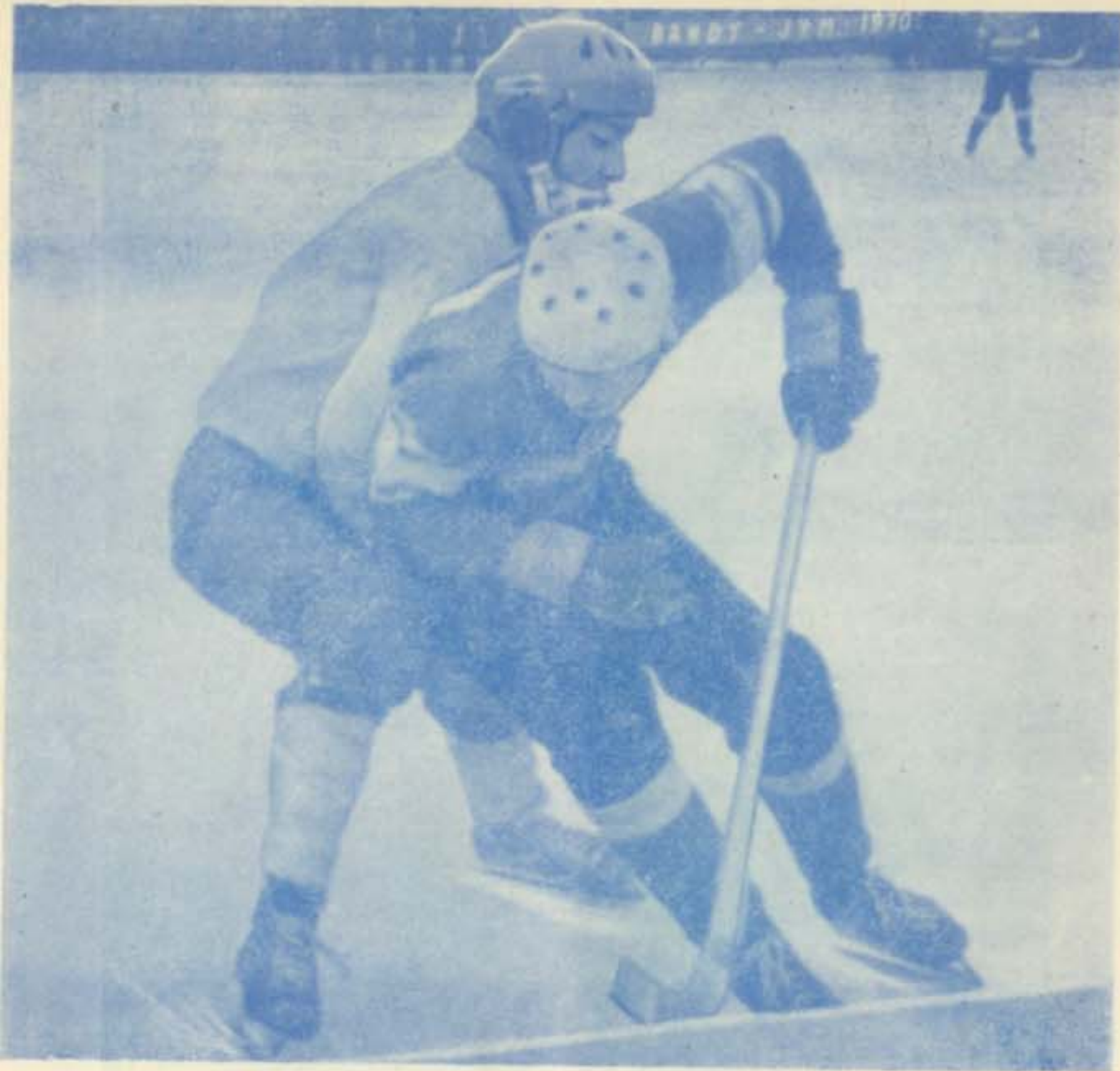
ТАБЛИЦА МЕЖДУНАРОДНОГО ТУРНИРА