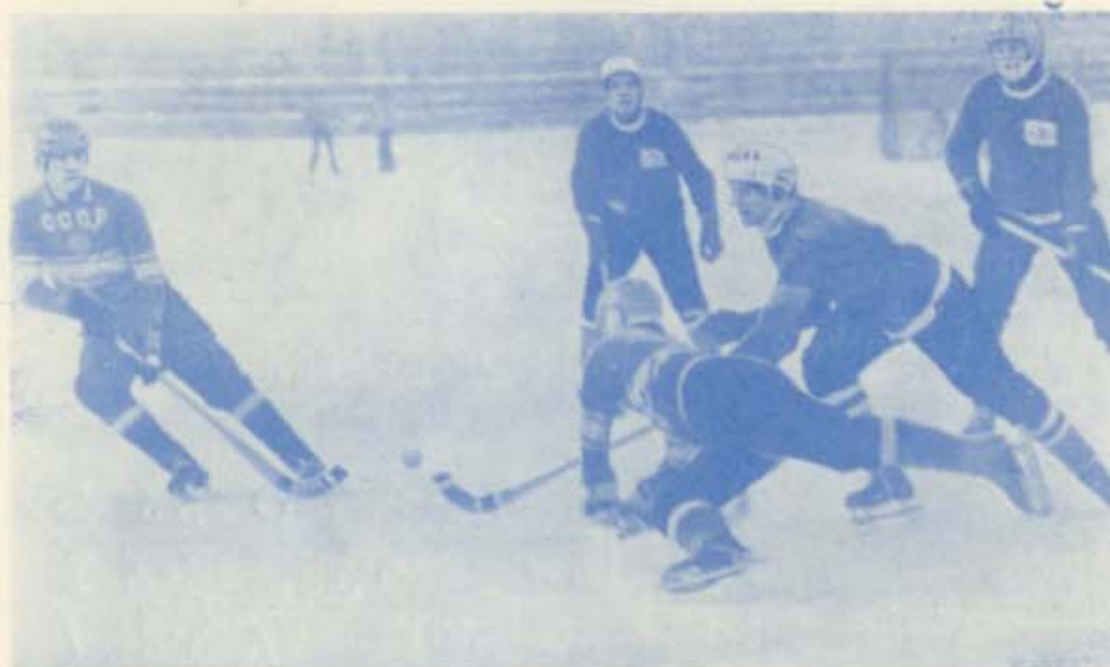
ЯНВАРЬ 1972 ГОДА. С НОВА АРХАНГЕЛЬСК СТАЛ МЕСТОМ ТОВАРИЩЕСКИХ МАТЧЕЙ ЮНОШЕСКОЙ СБОРНОЙ СССР С ГОСТЯМИ ИЗ-ЗА РУБЕЖА — ФИНСКОЙ КЛУБНОЙ КОМАНДОЙ ВЫСШЕЙ ЛИГИ «АКИЛЛЕС».