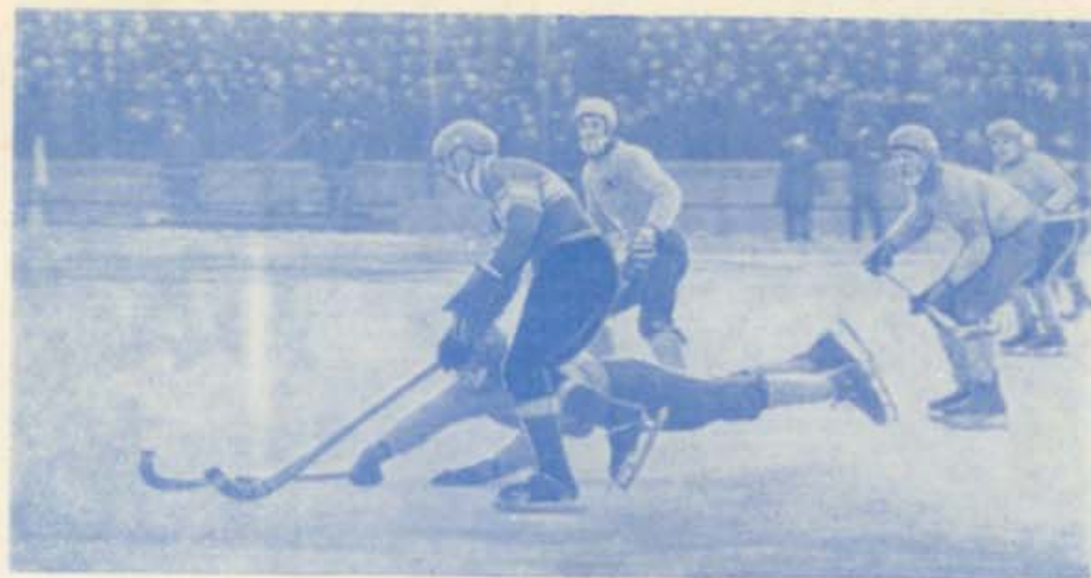
МАРТ 1970 ГОДА, АРХАНГЕЛЬСК. II ЧЕМПИОНАТ МИРА СРЕДИ ЮНИОРОВ. В УПОРНОЙ БОРЬБЕ ПРОХОДИЛ МАТЧ ЮНОШЕЙ ШВЕЦИИ И СОВЕТСКОГО СОЮЗА. СО СЧЕТОМ 2:1 ПОБЕДУ ОДЕРЖАЛИ СОВЕТСКИЕ ЮНИОРЫ И ВПЕРВЫЕ СТАЛИ ЧЕМПИОНАМИ МИРА.

СБОРНАЯ ЮНИОРОВ СССР — «ВОДНИК» (АРХАНГЕЛЬСК).