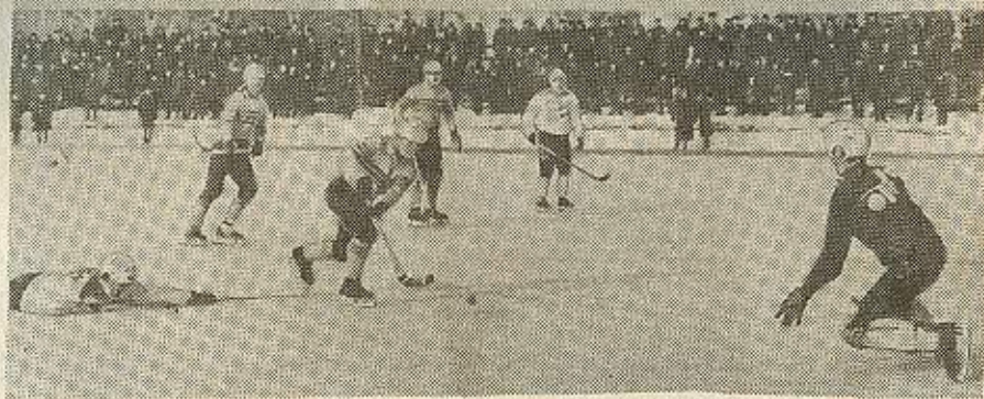
г. Архангельск, «Водник» — «ОЛС» (Финляндия) 5 марта 1969 г.